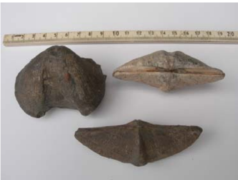
Cyrtospirifer sp.(verneuilli of grabau)